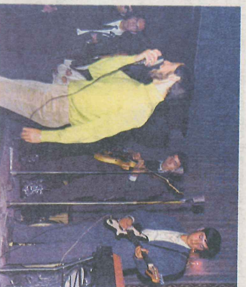
Da sinistra, Le Fure, i Pakipa sul palco

50 Un patrimonio di mezzo secolo fa che ora si punta a mettere in cassaforte